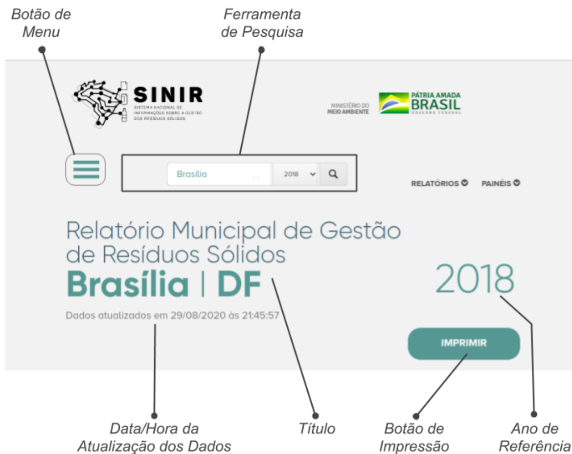
Fig. 1.1 - Cabeçalho de um relatório