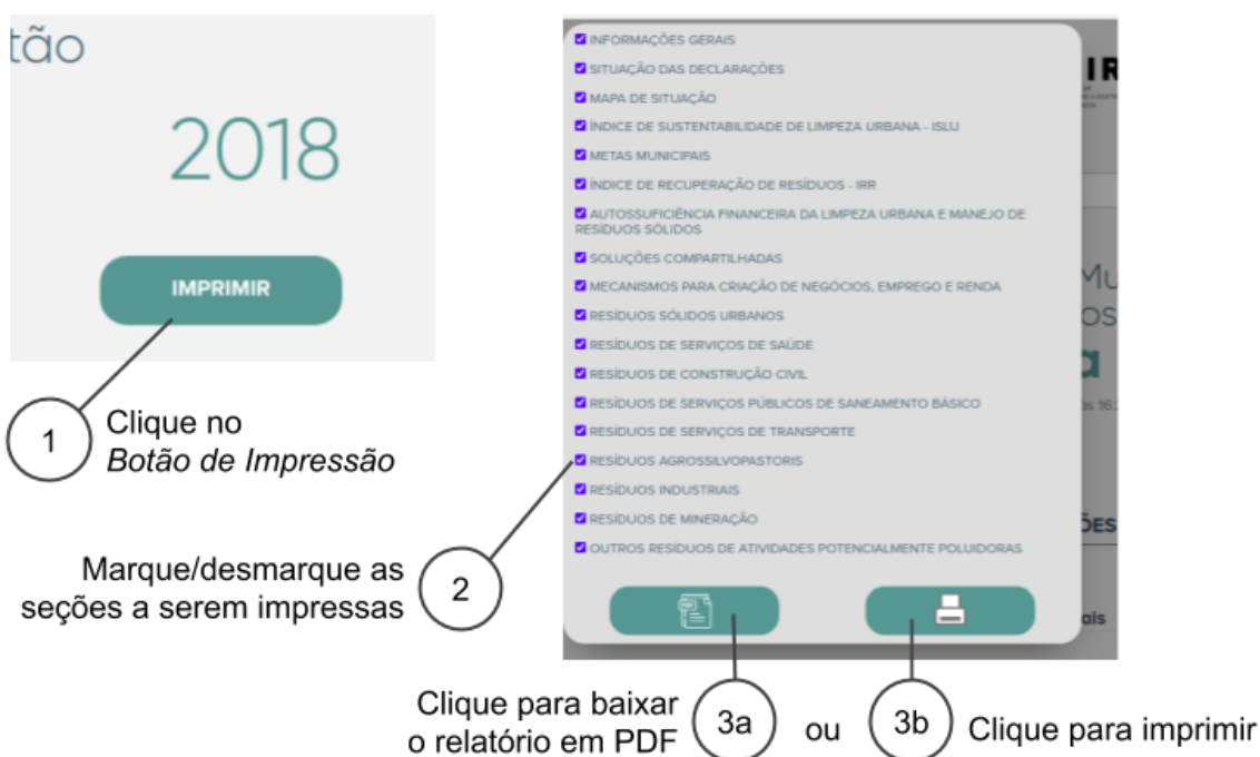
Fig. 1.4 - Imprimindo o relatório