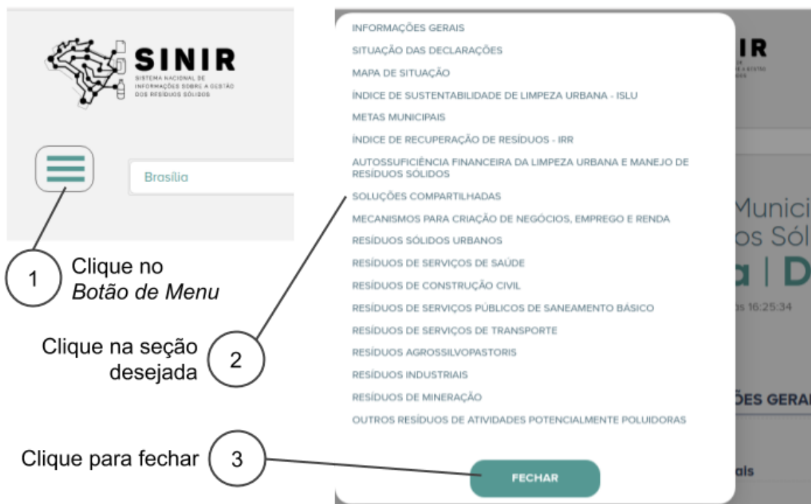
Fig. 1.3 - Navegando no relatório a partir do menu